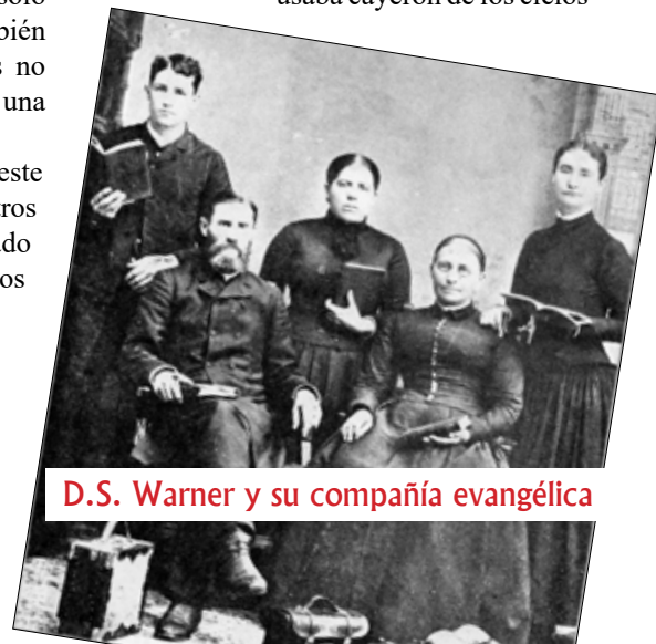
D.S. Warner y su compañía evangélica

1895: En el 1 de diciembre, D.S. Warner predicó su último mensaje (acerca del crecimiento cristiano).